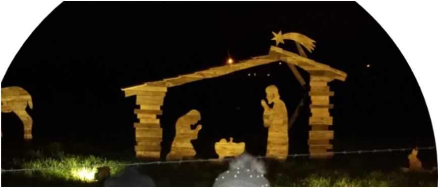
De kerststal die door meeste deelnemers genomineerd werd als de leukste, mooiste, ... stond dit jaar in de Daalstraat (Kester)!